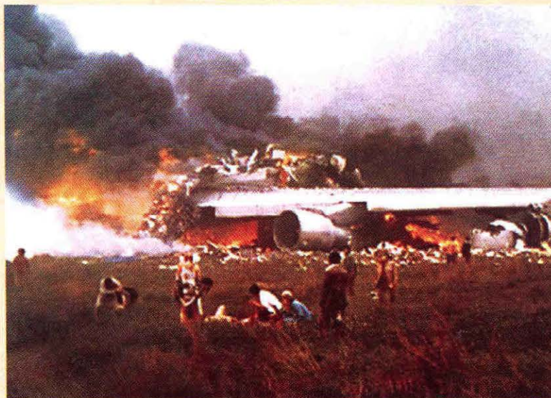
Los Rodeos, TENERIFE, ESPAÑA MARZO 27, 1977, Islas Canarias, 27.

La Organización de Aviación Civil Internacional (OACI) ha centrado su atención en el gran impacto que este tipo de accidentes tiene en la seguridad operacional y es así como en unión