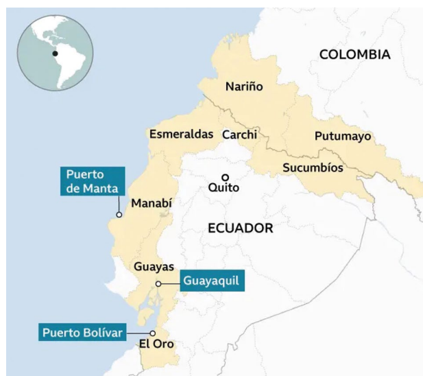
Figura 1. Zonas clave del narcotráfico en el Ecuador

las costas ecuatorianas; a través de pistas clandestinas ubicadas a lo largo del perfil costero, los cargamentos son embarcados en aeronaves hacia destinos en toda la región. Así, el medio aéreo se ha convertido en uno de los principales canales para el tráfico de drogas.