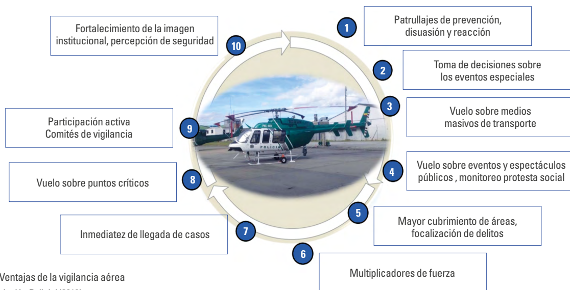
Figura 2. Ventajas de la vigilancia aérea Fuente: Aviación Policial (2019).

El uso de aeronaves remotamente tripuladas, en este caso drones, en la seguridad ciudadana ha sido reconocido por el presidente Iván Duque (2018-2022) como tecnologías con altas bondades, debido a los aportes que ofrecen en las capacidades de inteligencia y contrainteligencia en los centros rurales y urbanos. Proporcionan ventajas en el monitoreo a distancia y