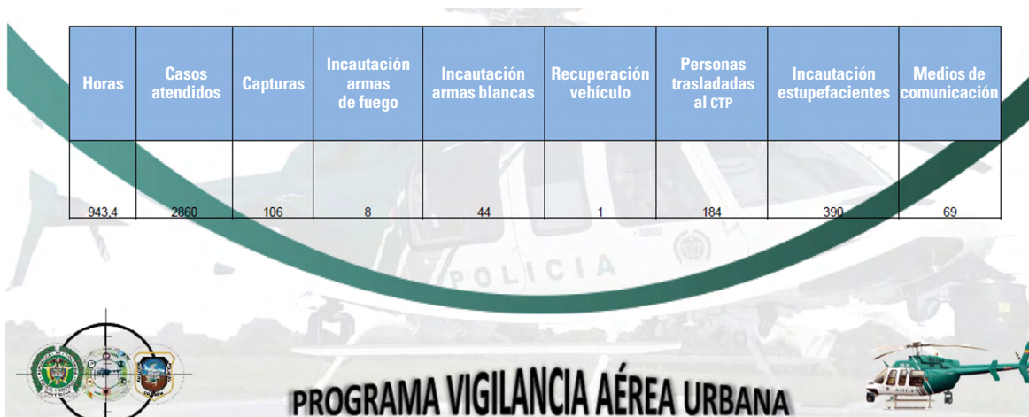
Figura 4. Estadística de casos y logros de la vigilancia aérea con el Halcón en 2020 Fuente: Aviación Policial (2020).