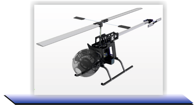
Figura 1. Prototipo del UAV.

El objetivo principal del UAV es hacer vigilancia, fotografía aérea y reconocimiento aéreo, de acuerdo con las restricciones de operación más relevantes como su autonomía, la cual es de aproximadamente una (1) hora, a una altura máxima de 3600 msnm (Alvarado, 2010), adicionalmente requiere una estructura capaz de soportar el peso de una cámara en la parte frontal. En la Figura 1 es posible observar una imagen en CAD del prototipo del UAV.