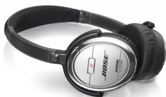
Figura 3. Auriculares de cancelación

El desarrollo tecnológico en la mejoría de la protección auditiva y comunicaciones en el medio aeronáutico se evidencia con la aparición de auriculares con cancelación de ruido (Catalán, 2011). Estos auriculares pueden ser: de ruido pasivo, que bloquean el ruido de fondo para disminuir el estímulo al oído, simulan estar en una habitación tranquila para alejarse del sonido, similar a una cámara sonomortiguada recibiendo solo el sonido que se genera de los equipo de comunicaciones o reproductores; y los auriculares de cancelación de ruido activo, los cuales requieren de una batería para accionar un pequeño micrófono exterior que recoge la muestra del ruido de fondo y produce un sonido opuesto en los auriculares para cancelar el ruido, estos no son tan efectivos como los auriculares de ruido pasivo, ya que producen un silbido al cancelar el ruido no deseado, sin embargo filtra el ruido permanente como el de un motor de avión. Las ventajas de estos auriculares con cancelación de ruido es que permiten mantener la comunicación oral, son más ligeros y pequeños en el diseño (Bose, 2015) (Rodríguez, 2013). Estos auriculares ya han sido incorporados en algunas aeronaves o son adquiridos por las tripulaciones según sus necesidades personales para su autocuidado auditivo (ver figura 3).