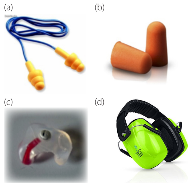
Figura 1. (a) Protectores de caucho; (b) Protectores de espuma; (c) Protectores de silicona vulcanizada; (d) diadema

reduciendo los efectos del ruido. Hay diferentes tipos de protectores: de diadema, adaptados al casco y de inserción, entre ellos están de espuma, caucho y silicona (ver figura 1).