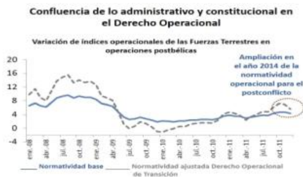
Figura 3. Articulación administrativa y constitucional del Derecho Operacional para periodo post-bélico.

la aplicabilidad de la articulación del Derecho Operacional y sus aristas de comunión con el Derecho Administrativo Operacional y el Derecho Constitucional.