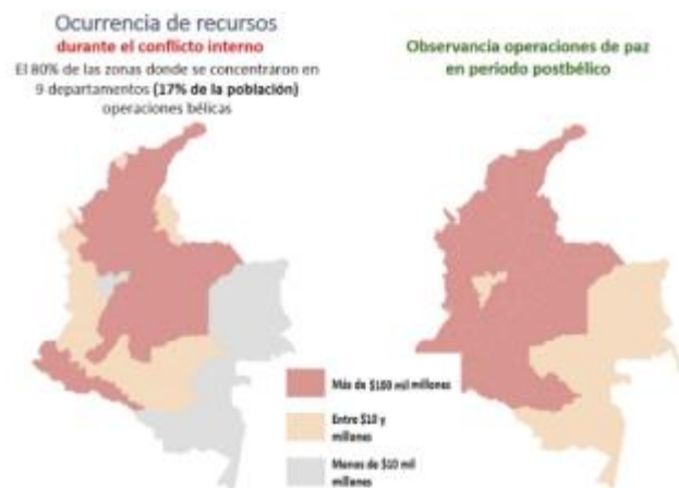
Figura 4. Comparabilidad operativa en costos durante el conflicto y observancia de proyección de las Fuerzas Terrestres en periodo post-bélico.