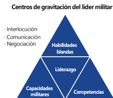
Figura 1. Liderazgo gravitacional militar.

Estos fundamentos se basan en las aristas que rigen las propiedades del liderazgo militar tal como lo ilustra la Figura 1.