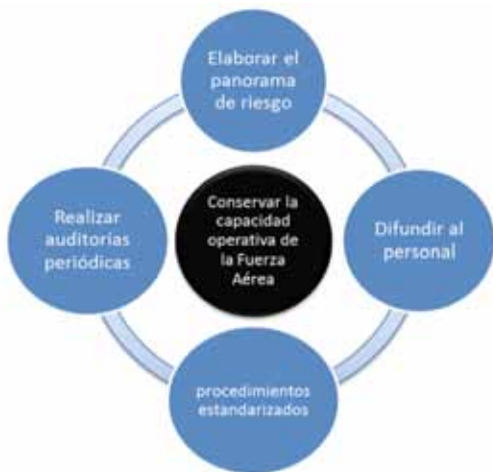
Figura. 1 Objetivos del Programa GAP. Elaborado por TE. Roa, P. y TE. Monsalve, J., (2011).