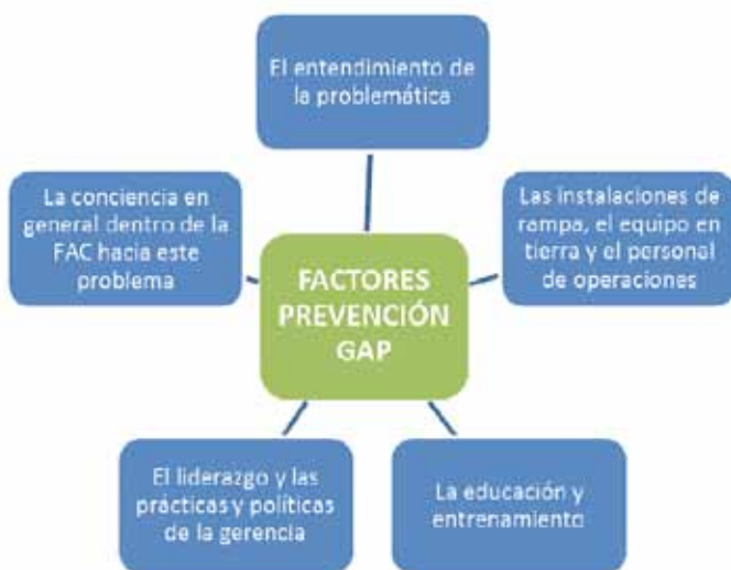
Figura 2. Factores Contribuyentes GAP. Elaborado por TE. Roa, P. y TE. Monsalve, J.(2011).

Los factores que contribuyen a que se presente una novedad operacional en tierra son: el entendimiento de la problemática; las instalaciones de rampa, el equipo en tierra, el personal de operaciones; la educación, el entrenamiento; el liderazgo, las prácticas y políticas de la gerencia; la conciencia en general dentro de la FAC hacia el problema (Ver Figura 2).