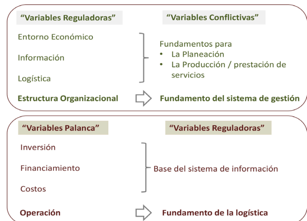
Figura 3. Relaciones complementarias y de soporte.

Asimismo, se infiere la caracterización dada a las “variables palanca” cuando se observa el complemento dado a las “variables reguladoras” (Figura 3).