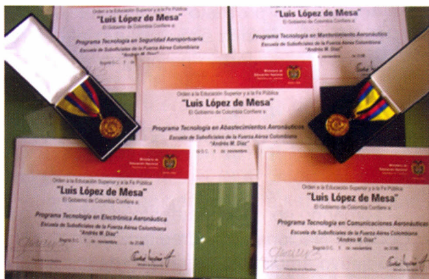
Foto 1. Diplomas acreditación

Mas... llegando hacia lo tangible se hace necesario como ya se expresó demarcar la ruta de la calidad que en el momento histórico de la escuela apunta tanto a la Recertificación de programas como a la Acreditación Institucional y al nacimiento de nuevos programas tecnológicos Aeronáuticos. Cada una de estas vertientes ha sido cobijada con un proyecto específico, dos de los cuales ya han sido referenciados en anteriores ediciones de esta revista. Hoy esbozamos el "Rotor II" que está siendo desarrollado por toda la comunidad, pero especialmente exige el trabajo mancomunado de los directivos de cinco programas tecnológicos aeronáuticos :